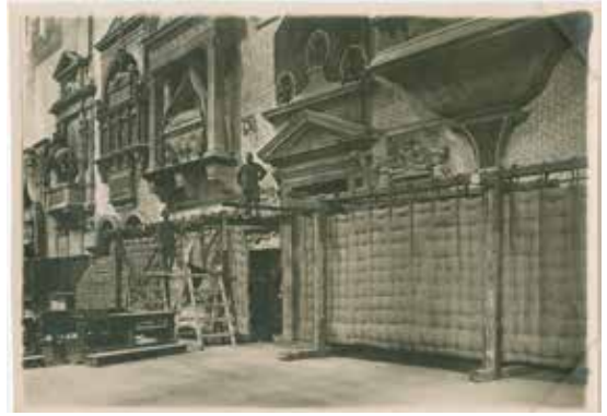
17. Giovanni Caprioli (?) Chiesa dei SS. Giovanni e Paolo. Interno. Protezioni con insaccate e materassi para-schegge, stampa alla gelatina, 1915